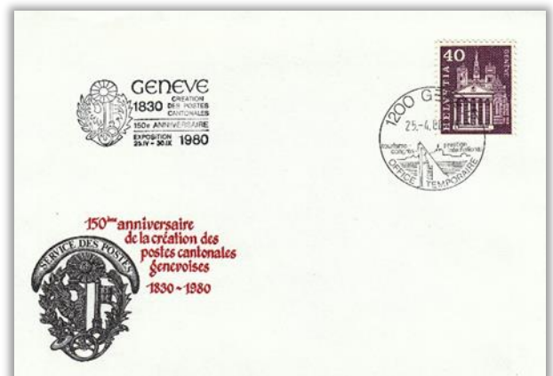
Sonderpoststelle in Genf mit Zusatzstempel „GENEVE 1830 création des postes cantonales“.