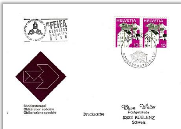
Stempel von der Sonderpoststelle in Bern mit Zusatzstempel „10. FEIEA Kongress“.