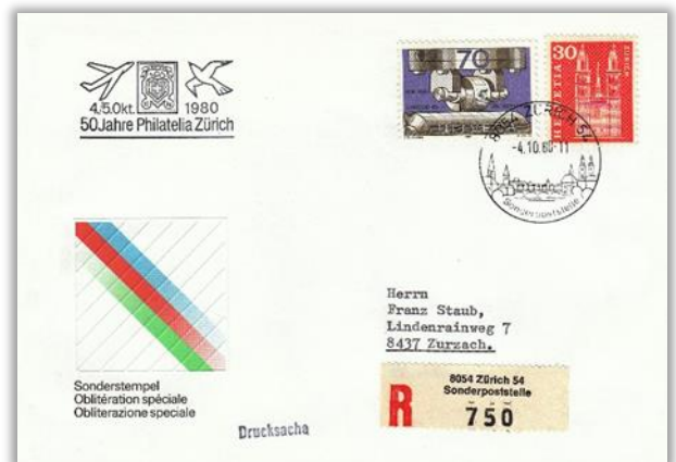
Sonderpoststellen-Stempel Zürich 54. Zusatzstempel „50 Jahre Philatelia Zürich“.