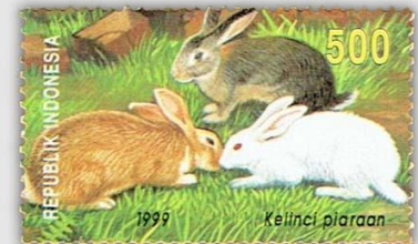
Kaninchen sind nicht gerne allein. Sie sind verspielt und brauchen viel Platz.