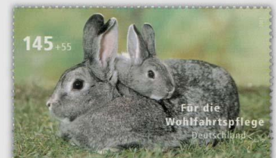
Die unterschiedlichen Züchtungen lassen bei Kaninchen fast keine Wünsche offen. Ob gross, ob klein, mit langen oder kurzen Haaren, mit grossen oder kleinen Ohren, alles ist möglich. Farben sind von braun, weiss, grau bis schwarz oder in verschiedenfarbigen Flecken zu sehen.