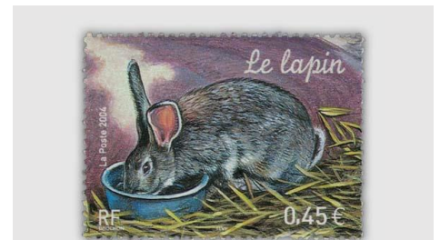
Um gesund zu bleiben braucht das Hauskaninchen eine besonders gute Pflege. Die Sauberkeit beim Fressgeschirr oder Schlafplatz ist dabei sehr wichtig.

Es gibt Kaninchen die mögen es, wenn sie gestreichelt werden. Ängstliche Tiere sollten jedoch in Ruhe gelassen werden. Sie kommen von alleine zu euch, wenn sie das wollen. Hast du gewusst, dass Kaninchen auch Tricks lernen können? Sie können zum Beispiel über Hürden springen oder durch Tunnel und über Brücken laufen.