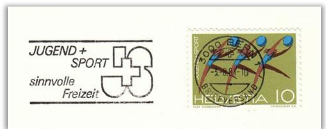
Für Gesundheit durch den Wintersport und eine sinnvolle Freizeit für die Jugend werben diese beiden Flaggenstempel.