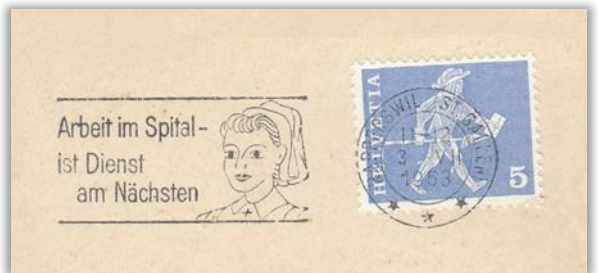
Werbung für eine gesunde Wirtschaft und für das Spital als Arbeitgeber.