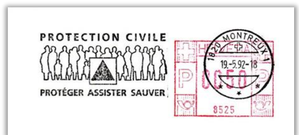
Thema bei diesen Werbeflaggen ist der Bevölkerungsschutz durch den Zivilschutz. Rechts: Flagge in französischer Sprache.