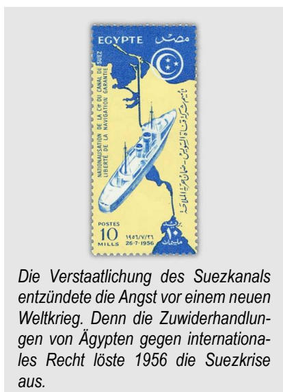
Die Verstaatlichung des Suezkanals entzündete die Angst vor einem neuen Weltkrieg. Denn die Zuwiderhandlungen von Ägypten gegen internationales Recht löste 1956 die Suezkrise aus.

Der Suezkanal ist ein wichtiger Knotenpunkt für Schiffe aus der ganzen Welt. Etwa acht Prozent des Schifffahrtswelthandels wird über den Suezkanal abgewickelt. Ob Russland, China oder die USA, alle Staaten dieser Welt haben ein Interesse daran, diesen Transportweg weiterhin benutzen zu können.