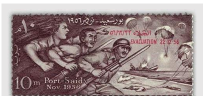
Die alliierten Fallschirmjäger besetzten unter heftiger Gegenwehr der ägyptischen Soldaten das Gebiet am Suezkanal.

Zehn Jahre später (1967) führten die Spannungen zwischen Ägypten und Israel ein weiteres Mal zum Krieg. Israel besetzte im Sechstagekrieg das Ostufer vollständig. Der Kanal wurde abermals für die israelische Schifffahrt gesperrt. Während der Krieg nur gerade sechs Tage dauerte, war ein Konvoi mit 14 Handelsschiffen acht Jahre lang im Kanal eingesperrt. Der Kanal blieb von 1967 bis 1975 geschlossen. Im Oktober 1973 durchbrach die ägyptische Armee die Blockade Israels und begann mit den Aufräumarbeiten. Tausende von Minen, Bomben