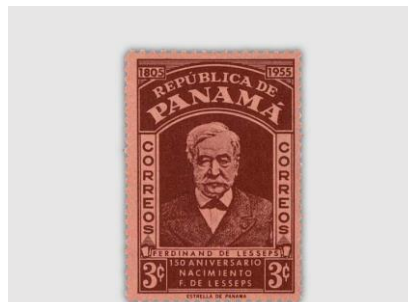
Da Graf Ferdinand Vicomte de Lesseps den Bau dieser künstlichen Wasserstrasse überwachte, wird er in der Geschichte "Vater des Suezkanals" genannt.

deutete, dass keine Schleusen gebaut werden mussten.