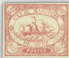
Briefmarke der Kanalgesellschaft, die von Ferdinand de Lesseps 1858 gegründet wurde.

1858 gründete Graf Ferdinand de Lesseps die Suez-Kanal-Gesellschaft "Compagnie Universelle Du Canal Maritime de Suez". Bei dieser Gründung wurde festgelegt, dass Ägypten nach 99 Jahren den Kanal zurückerhält.