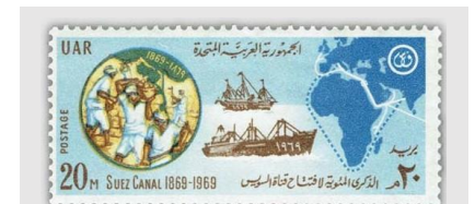
Diese Briefmarke zeigt (gestrichelten Linie) jene Route, die Schiffe vor dem Bau des Kanals passieren mussten. Die weiße Linie zeigt die Abkürzung durch den Suezkanal zwischen England und Indien.

Am 17. November 1869 war es dann soweit: Der Suezkanal konnte feierlich mit vielen Gästen eröffnet werden.